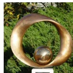
3: Marx György Vándordíj

A Marx György Vándordíjat minden évben az az iskola nyeri el , akinek a tanulói a legeredményesebben szerepelnek a versenyen. A Vándordíj nyertese 2019. évben újra a budapesti Piarista Gimnázium csapata lett.