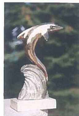
2: Szilárd Leó Tanári Delfin-díj