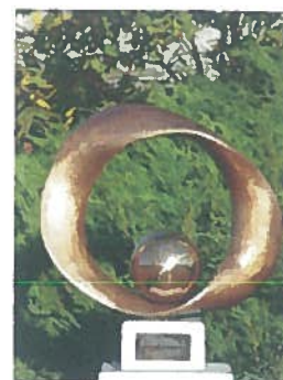
3: Marx György Vándordíj

A Marx György Vándordíjat minden évben az az iskola nyeri el , akinek a tanulói a legeredményesebben szerepelnek a versenyen. A Vándordíj nyertese 2016. évben újra a budapesti Baár-Madas Református Gimnázium csapata lett.