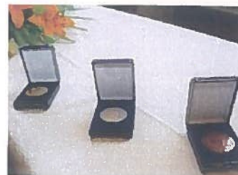
1: Szilárd Leó arany, ezüst, bronz fokozatú vert érmek